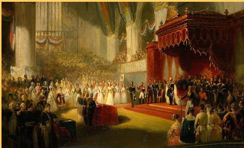
De inhuldiging van Willem II op 28 november 1840

Willem II regeerde slechts korte tijd als constitutioneel vorst. Na het overlijden van zijn lievelingszoon Alexander ging zijn gezondheid achteruit. Ook de problemen met zijn oudste zoon, de latere koning Willem III, gingen hem niet in de koude kleren zitten. Kroonprins Willem was het namelijk helemaal niet eens met de grondwetswijziging waar zijn vader mee had ingestemd. Hij deed zelfs schriftelijk afstand van zijn rechten op de troon, wat hij later weer introk.