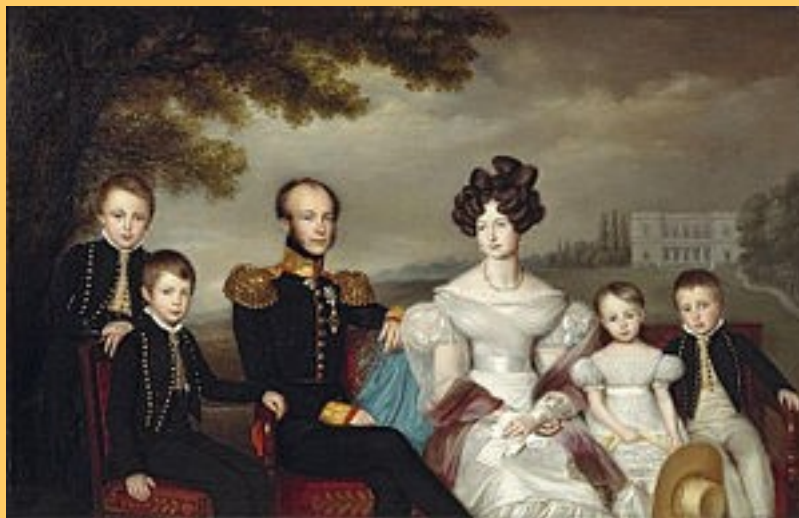
Het Koninklijke gezin rond 1828

Willem II regeerde slechts korte tijd als constitutioneel vorst. Na het overlijden van zijn lievelingszoon Alexander ging zijn gezondheid achteruit. Ook de problemen met zijn oudste zoon, de latere koning Willem III, gingen hem niet in de koude kleren zitten. Kroonprins Willem was het namelijk helemaal niet eens met de grondwetswijziging waar zijn vader mee had ingestemd. Hij deed zelfs schriftelijk afstand van zijn rechten op de troon, wat hij later weer introk.